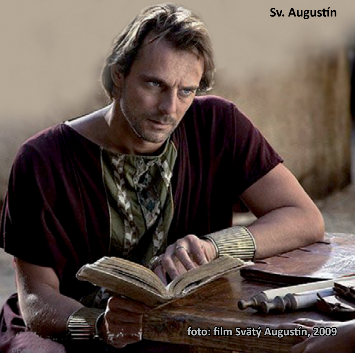
foto: film Svätý Augustín, 2009